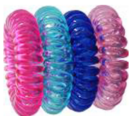
1. Banda elástica