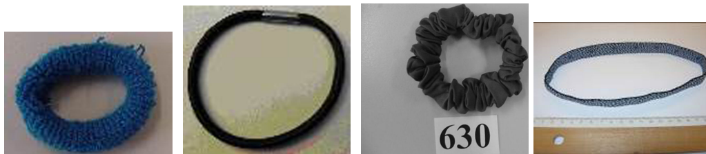
1. Banda elástica