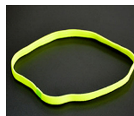
3. Fita para o cabelo