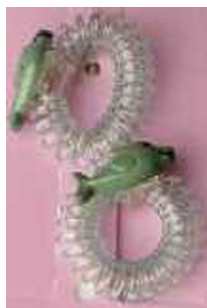
2. Banda elástica